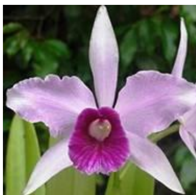
Figura 1: L. purpurata padrão

(Sugestão: como regra para iniciantes em julgamentos, sugerimos que se compare a flor em análise com uma flor padrão da Laelia purpurata . Esta deve receber 50% dos pontos possíveis ou 50 pontos. Assim pode-se acrescentar ou retirar pontos da flor em análise partindo-se desse referencial).