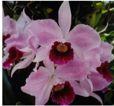
Figura 3: L. purpurata com cores bem definidas