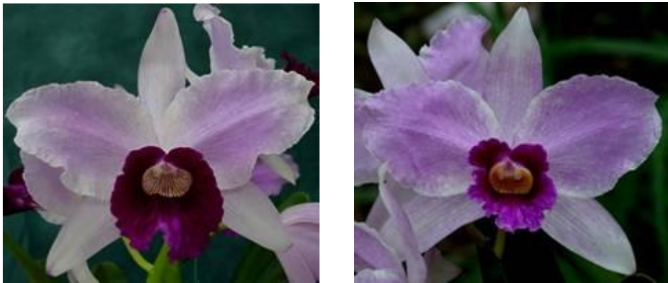
Figura 2: L. purpurata de formas excepcionais