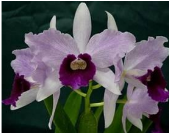
Figura 4: Flor ideal de L. purpurata : sépalas, pétalas, labelo, armação, colorido e tamanho ideais.